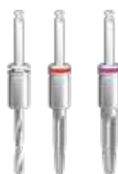
FRESE PER GUIDATA GD-PT-21 GD-PT-35 / GD-PT-47