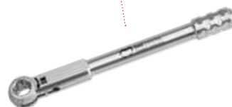
CRICCHETTO UNIVERSALE 00376