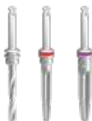
FRESE STANDARD PT-21CUT PT-35CUT / PT-47CUT